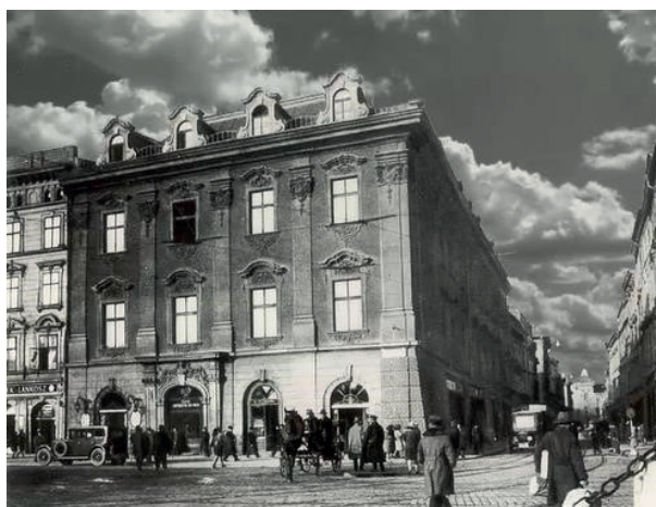
Siedziba Galicyjskiego Wojennego Zakładu Kredytowego, w kamienicy na krakowskim Rynku