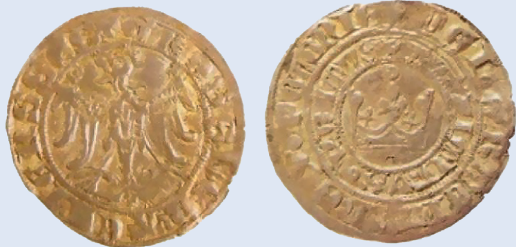
Grosz krakowski Kazimierza III Wielkiego

HTTPS://MONETYHISTORYCZNE.PL/STANISLAW-AUGUSTPONIATOWSKI-A-REFORMY-PIENIADZA/