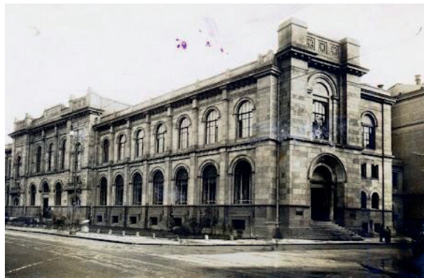
Historyczny budynek Reduty Banku Polskiego.

Po wojnie, w 1945 roku, powstał Narodowy Bank Polski, który z czasem stał się monopolistą w zakresie emisji pie-